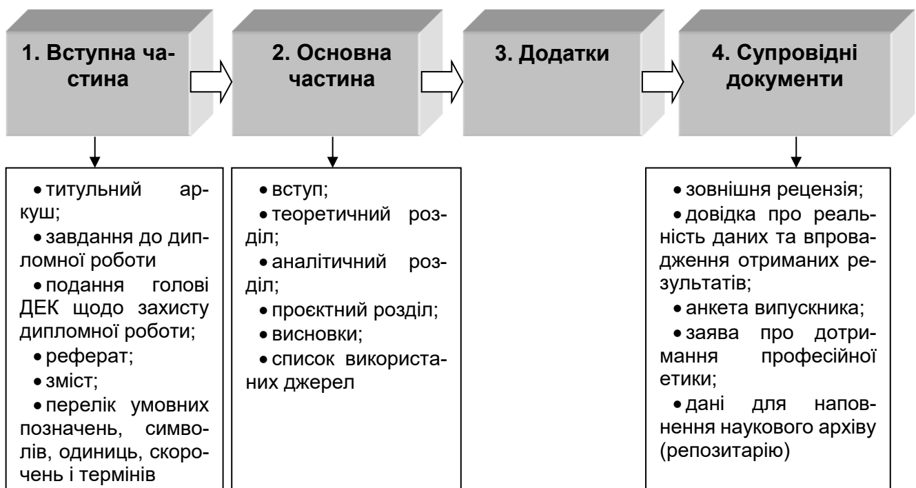
Рис. 2.1. Загальна структура магістерської дипломної роботи

Загальну структуру магістерської дипломної роботи наведено на рис. 2.1.